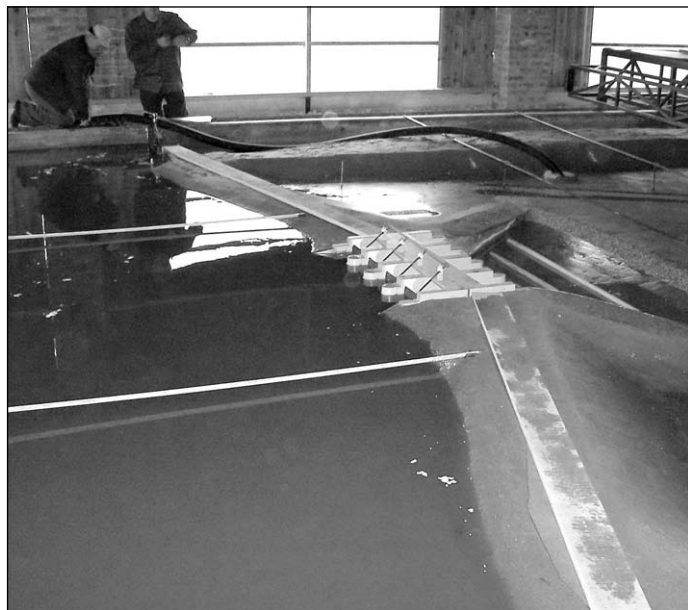
A Kisdelta árvízi szükségeltároló kisminta-kísérlete